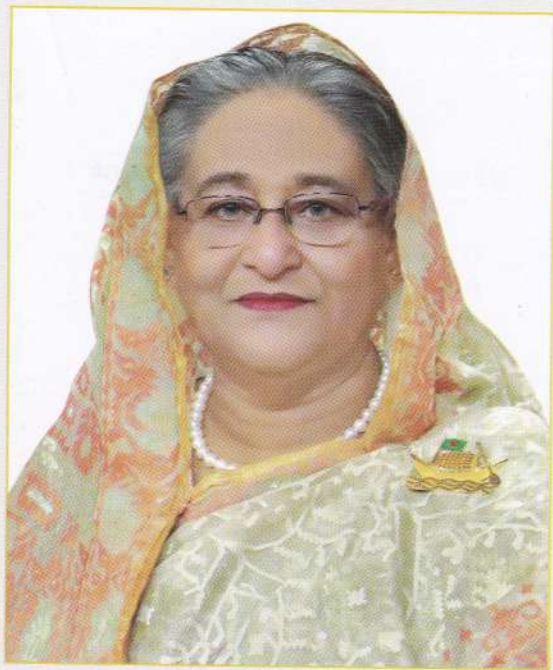
Sheikh Hasina Prime Minister Government of the People's Republic of Bangladesh